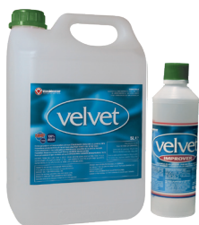
L 5 - L 0,5 IMPROVER